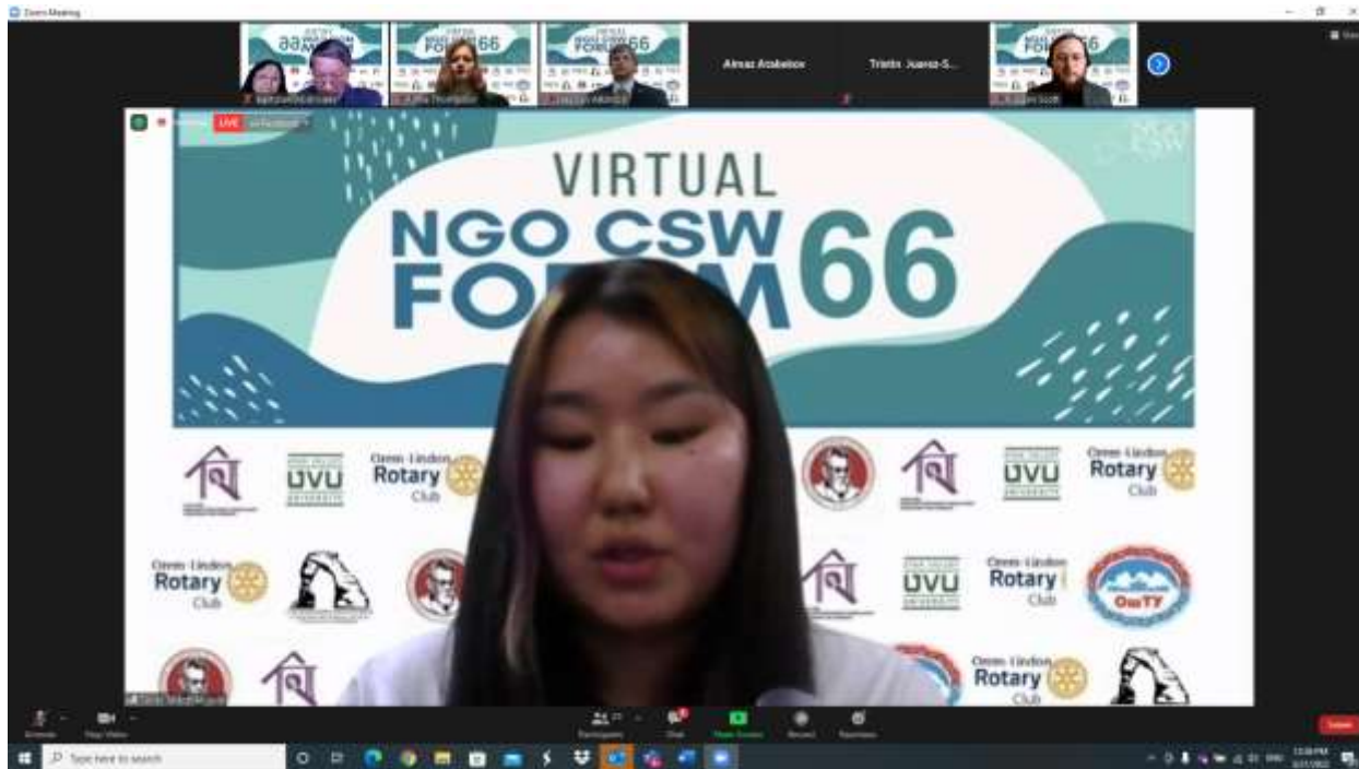
Моя презентация во время мероприятия

21 марта 2022 года состоялось грандиозное событие, повлиявшее на историю ОшТУ включая преподавателей и студентов, принявших участие в Виртуальном мероприятии в ходе 66-й сессии Комиссии ООН по статусу женщин (КСЖ66).