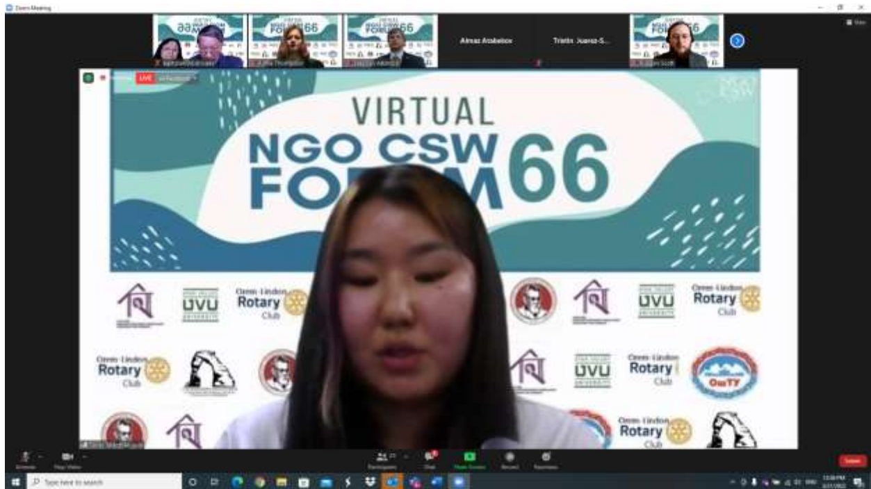
My presentation at CSW66

On March 21, 2022, a grand event took place that influenced the history of the Osh Technological University: teachers and students who participated in the Virtual Event of the 66th session of the UN Commission on the Status of Women (CSW66).